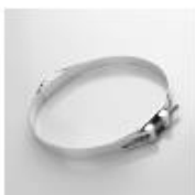
collier à vis tangente