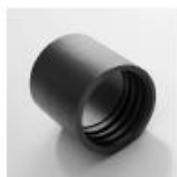
manchette PU surmoulée