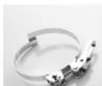
Car-Grip Collier à tourillons