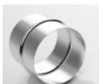
manchon de raccordement