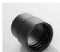
PU-manchette electriquement conductrice