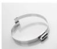
Car-Grip Collier à vis tangente