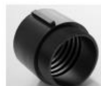
Combiflex PU-manchette à visser