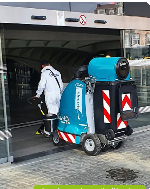
Grande souplesse d'utilisation

La pression du jet est réglable sur la lance (jet fin ou jet évasé).