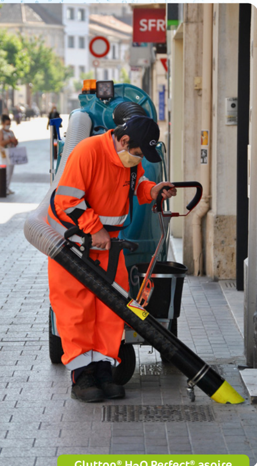
Glutton® H2O Perfect® aspire

Muni d'un nettoyeur moyenne pression et de 60 litres d'eau, l'aspirateur de voirie 100% écologique Glutton® H2O Perfect® permet de nettoyer en profondeur les moindres recoins de votre ville :