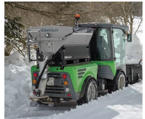
Salz- und Kiesstreuer