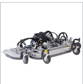
■ Triplex Heckauswurfmäherwerk 2500