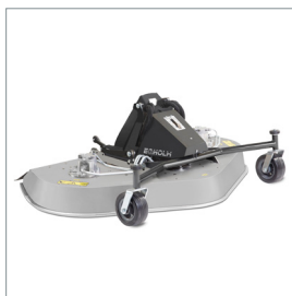
■ Heckauswurf-/ Mulchmäherwerk 1500