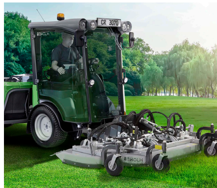
Triplex Heckauswurfmäherwerk 2500