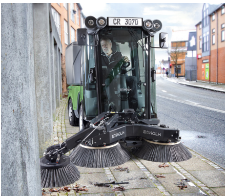
Kehmaschine mit 3. Besen