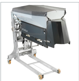
□ Salz- und Kiesstreuer

Egholm A/S - 01.05.2021 - Die Spezifikationen und detaillierten Informationen können ohne Vorankündigung Änderungen unterliegen. Die Abbildungen können auch Zusatzausstattung zeigen.