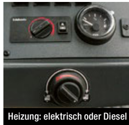
Heizung: elektrisch oder Diesel