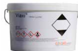
Eimer 3,5 kg