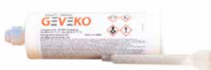
Mine 380 ml

Viaxi® ist ein effektives zwei Komponenten Bindemittel, das speziell für Beton-, Kopfsteinpflaster- und Fliesenoberflächen entwickelt wurde. Die geschätzte Anwendungsmenge ist ungefähr 300ml/m 2 , d.h. 220g/m 2 .